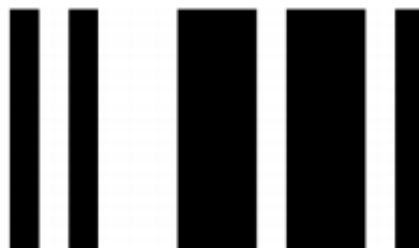
Detector de líneas