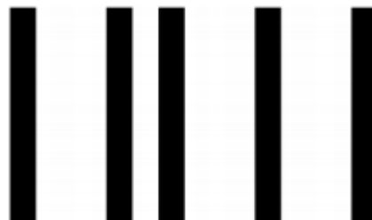
Seguidor de líneas